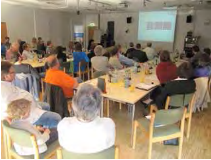
Leipziger Umweltstammtisch im Kubus

Fokus Umwelt , die Veranstaltungskooperation von Helmholtzzentrum für Umweltforschung UfZ, Förderverein Umweltinformationszentrum der Stadt Leipzig, Landesstiftung Natur und Umwelt und der Umweltbibliothek Leipzig, haben mit dem Umweltstammtisch eine Netzwerkveranstaltung für in Umweltbelangen Tätige und Engagierte der Region Leipzig erfolgreich wiederbelebt. Am 19. April kamen im Kubus des Umweltforschungszentrums über 60 Akteure aus den Bereichen Wirtschaft, Wissenschaft, Verwaltung, Planung, Politik und Vereinen zusammen. Mit Roland Zieschank von der Forschungsstelle Umweltpolitik der FU Berlin konnte mit Unterstützung des Oekom-Verlages einer der profiliertesten Vertreter der aktuellen Diskussion neuer Instrumente gesellschaftlicher